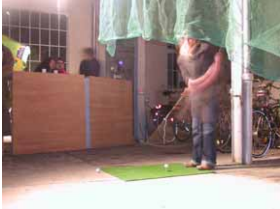
Vernissage: Abschlag im Hof