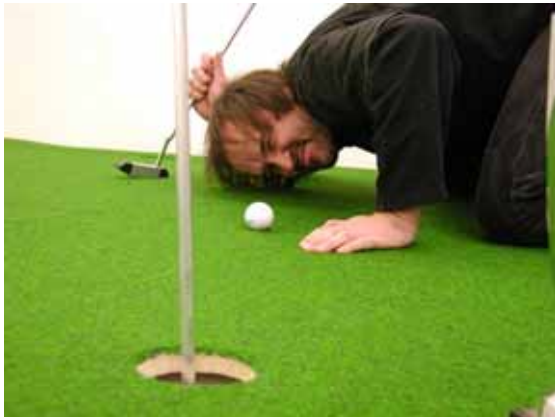
Heinrich Gartentor am Loch