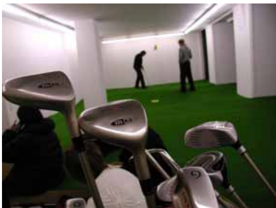
Schläger vor der Installation