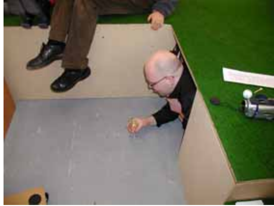
Eingang zur VIP-Lounge